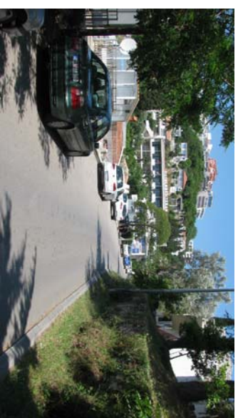
Pozicija f2 _____