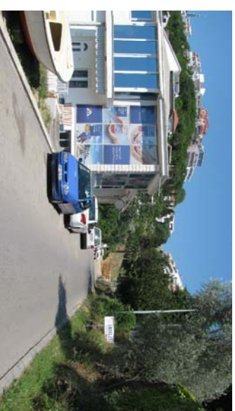
Pozicija f3 _____