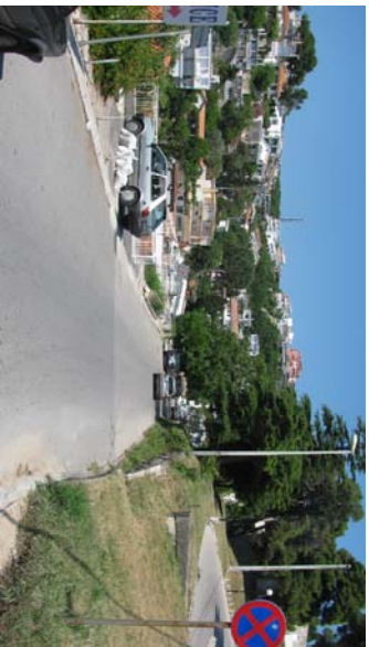
Pozicija f1 _____