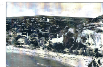
Lužnja Plana na Hotel Republican, oko 1910. godine, XIX stoljeće. Photos: 50-ih godina XX vijeka. Plans with Hotel Republican in the office of the XX century.