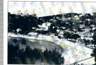
Lužnja Plana na Hotel Republican, oko 1910. godine, XIX stoljeće. Photos: 50-ih godina XX vijeka. Plans in the office of the XX century.

PRVA ZONA (C): Urbanističke parcele: UP16, UP17 i UP42. Oslobođanjem površina prizemlja planiranog objekata uspostavljen je vizuelni i fizički kontakt međusobne povezanosti zaleđa prostora i trga kao i otvorenost prema moru. Na ovaj način stvara se monumentalnost mediteranskog otvorenog trga koji nastaje kao spoj tradicije i mediteranske atmosfere ovog podneblja. U ovoj zoni se uvode nove forme kao i autohtona materijalizacija partera kao i zelene površine. Oplemenjavanje postojećih parkovskih površina sa starim borom i javorom.